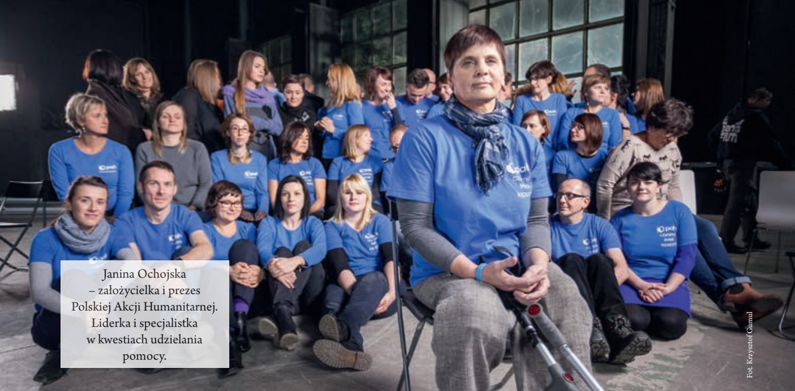
Janina Ochojska – założycielka i prezes Polskiej Akcji Humanitarnej. Liderka i specjalistka w kwestiach udzielania pomocy.