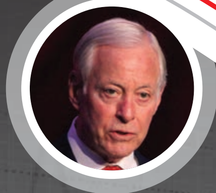
Brian Tracy Lider biznesu na świecie