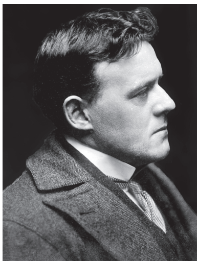
Ilustracja 1. Hilaire Belloc (1870–1953), portret z 1910 roku

decyzję o rozpoczęciu kariery pisarskiej, wybierając jednocześnie język angielski jako narzędzie swojej pracy 23 . Ostatecznie właśnie tożsamość Anglika okazała się dominująca w jego życiu (brytyjskim obywatelem stał się w kwietniu 1902 roku 24 ), choć pozostałe elementy jego rodowodu nigdy nie przestały wpływać u niego na złożony sposób postrzegania rzeczywistości 25 .