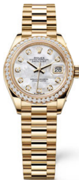
OYSTER PERPETUAL LADY-DATEJUST