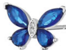
APART Kolczyki 124 zł.