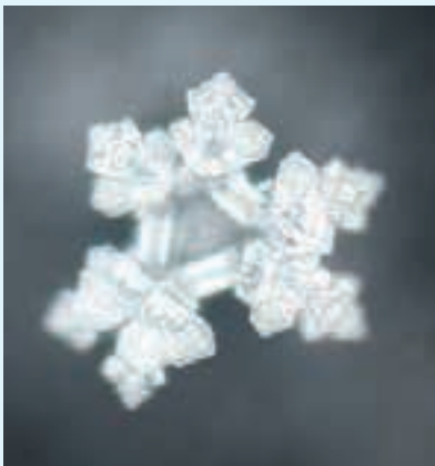
Kryształek wody połączony z eliksirem kwiatowym inspirującym do kreatywności.

Nigdy nie widziałam zdjęć kryształków wody podlegających wpływowi roślin czy ich kwiatów, więc wysłałam zespołowi dr. Emoto kilka próbek eliksirów kwiatowych, żeby zobaczyć jak będą wyglądać ich kryształki. Zdjęcia pokazały, że woda przechowuje energię kwiatów, która manifestuje się przez wysoko zorganizowane i zharmonizowane struktury, każda trochę inna niż pozostałe. Spójrz na zdjęcia i zastanów się co czujesz w związku z nimi.