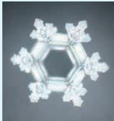
Kryształek wody połączony z eliksirem kwiatowym wywołującym radość.