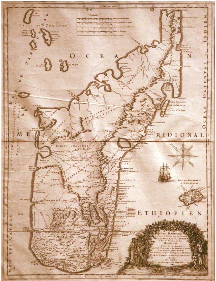
Madagascar, XVII w.