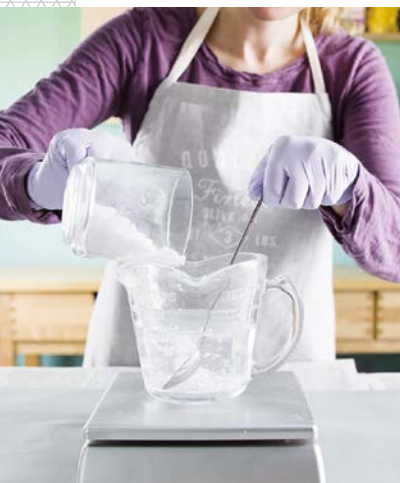
Mieszanie roztworu ługu.