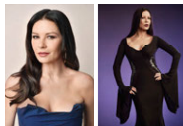
Na okładce: CATHERINE ZETA-JONES.

Lutowy numer „Zwierciadła” w sprzedaży od 4 stycznia.