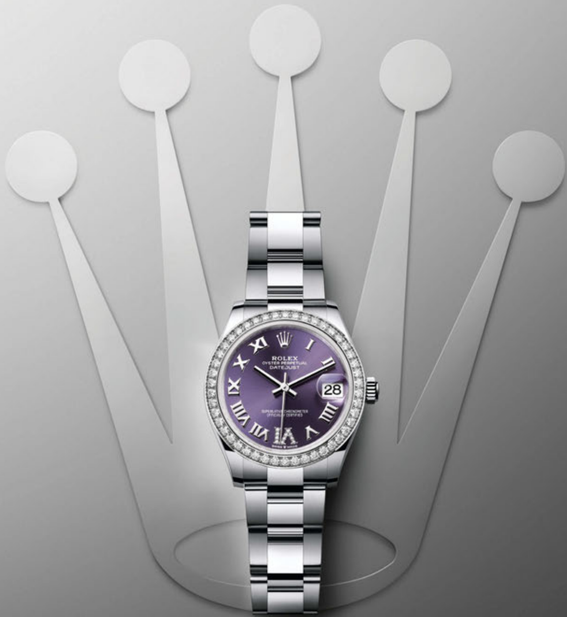
OYSTER PERPETUAL DATEJUST 31