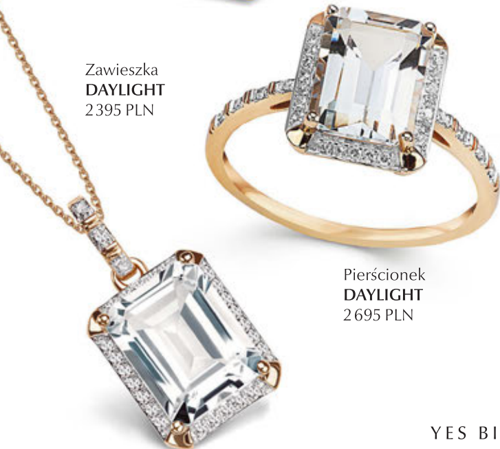
Pierścionek DAYLIGHT 2695 PLN