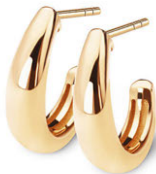
Kolczyki LA PRIMA 1395 PLN