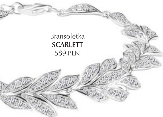
Bransoletka SCARLETT 589 PLN