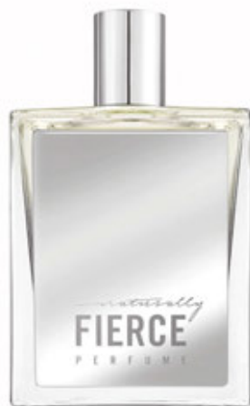
Autorki listów otrzymują ABERCROMBIE & FITCH – Naturally Fierce Eau de Parfum.