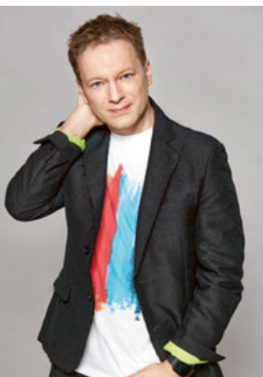
MACIEJ STUHR aktor. Wszechstronny. Gra, jak nie pisze. Pisze, jak nie gra.

Stanisław Soyka – wspaniały muzyk. Autor wielu niezapomnianych przebojów. Wydał kilkadziesiąt płyt, zagrał tysiące koncertów. Swego czasu został sparodiowany przez jednego z dzisiejszych felietonistów „Zwierciadła”. ●