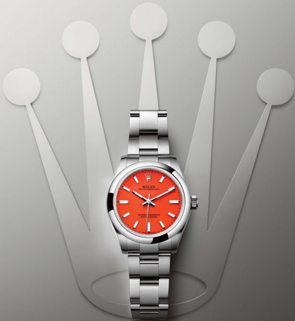
OYSTER PERPETUAL 31