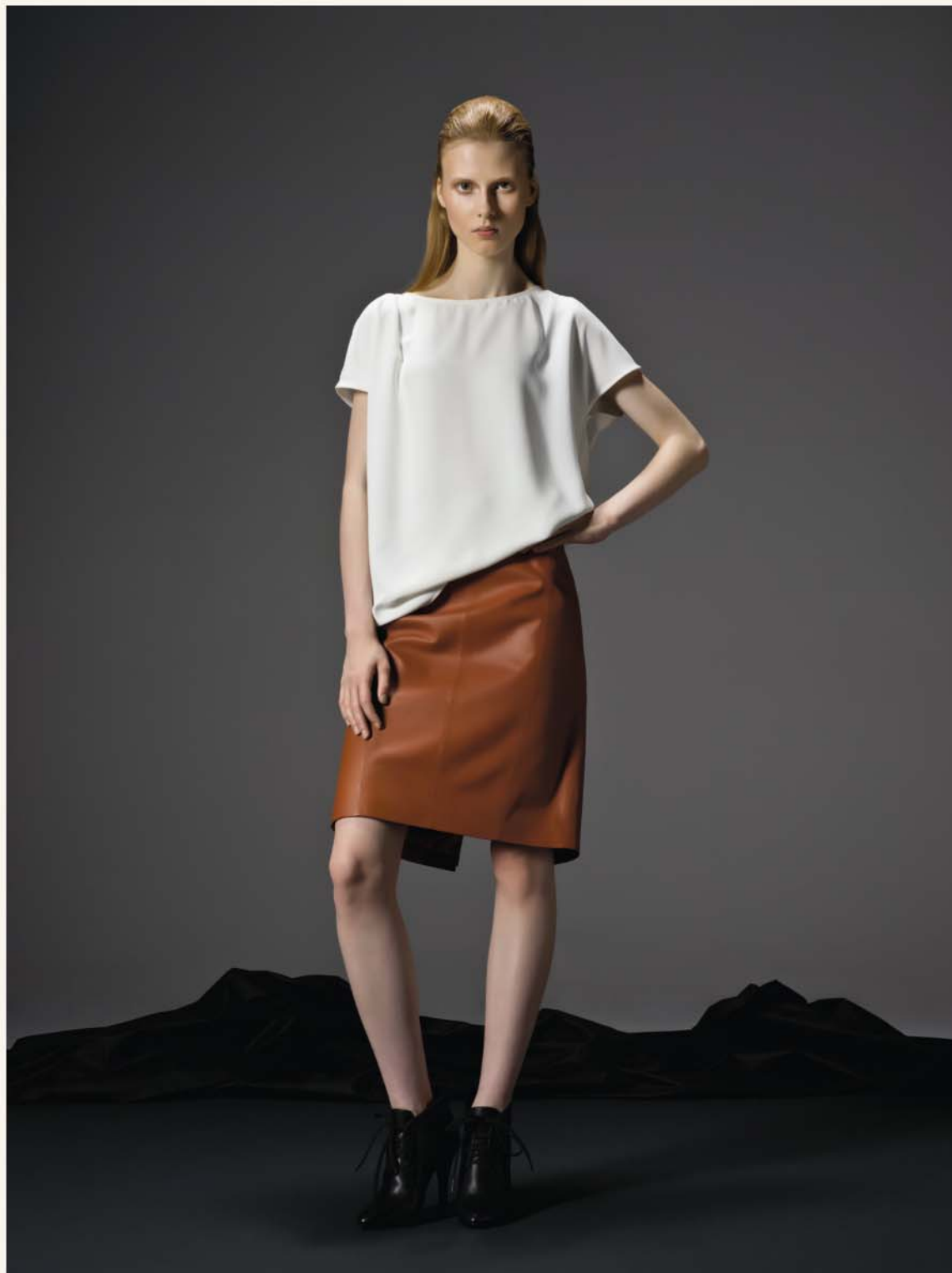
www.solar-company.com.pl