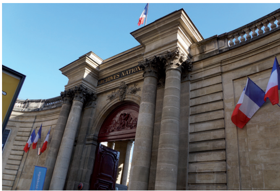
Musée des Archives Nationales. Wejście od Rue des Francs-Bourgeois.

Poza Paryżem istnieją jeszcze 4 ośrodki Archives Nationales :