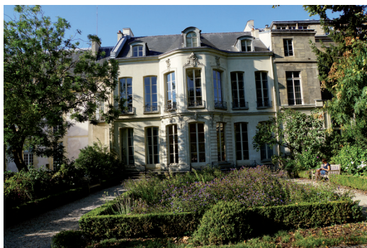
Hôtel de Fontenay.