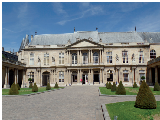
Hôtel de Soubise.