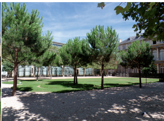
Hôtel de Rohan i CARAN (Centre de recherches des Archives nationales - Centrum Badań Archiwów Narodowych).

Hôtel de Breteuil – wybudowany w 1862 roku.