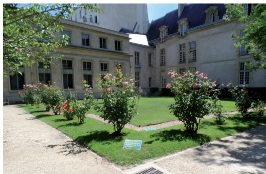
Hôtel de Jaucourt.

Hôtel de Jaucourt - idąc wzdłuż alei de la Roche podziwiamy tulipany, a droga ta prowadzi nas do ogrodu różanego tej rezydencji wybudowanej za panowania Karola V przez Jeana de Ligny.