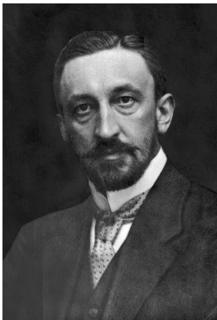
2. Józef Brudziński; Narodowe Archiwum Cyfrowe, sygn. 1-N-68