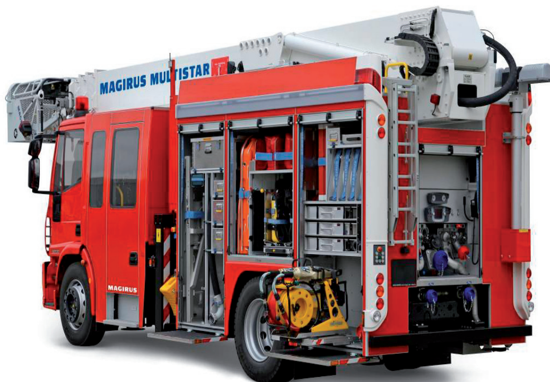
Ryc. 8. Specjalny wielofunkcyjny pojazd samochodowy typu Multistar 2 na podwoziu Iveco Magirus FF 180 E 30 (4x2)