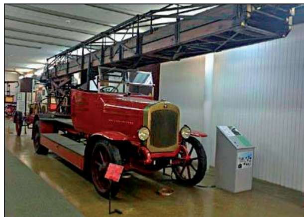
Ryc. 2. Drabina Magirus z 1924 roku o wysokości 20 m, znajdująca się w Muzeum Techniki w Zagrzebiu w Chorwacji [2].

stwo użytkownika. Jak wie każdy konstruktor- mechanik, większy wysięg takiego urządzenia to większy moment wywracający.