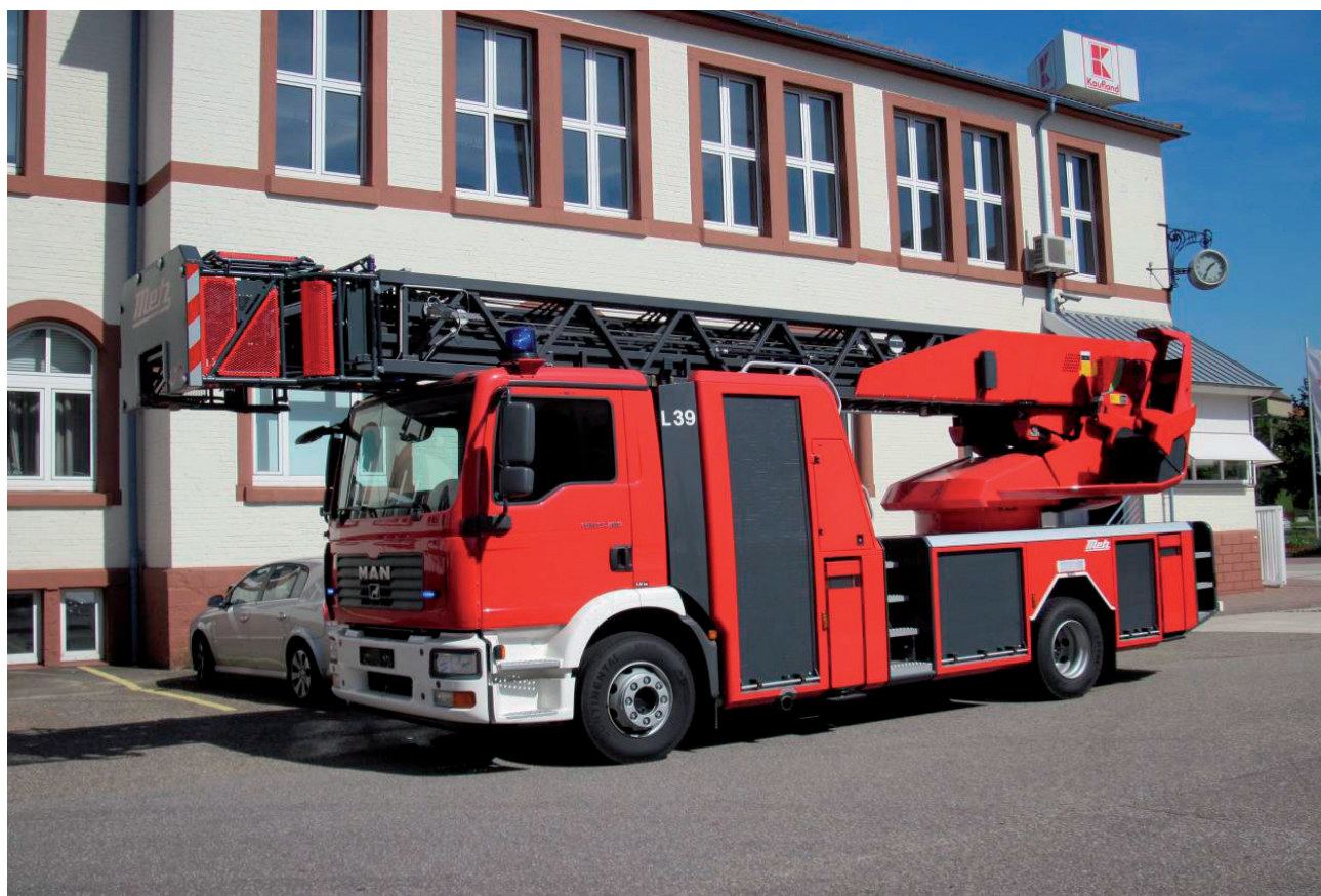
Ryc. 4. Drabina Metz L39, fot. Metz Aerial.

Kolejnym etapem rozwoju tych konstrukcji było zastosowanie napędu pneumatycznego mechanizmu podnoszenia oraz dostosowanie urządzenia do możliwości podnoszenia ludzi. Wadą tych rozwiązań było to, że podnosiły one ładunki i ludzi wyłącznie w pionie. Ponadto w układach pneumatycznych nie było możliwości sterowania płynnego, ruchy były szarpane. Nieznaczną poprawę komfortu zapewniły rozwiązania hydrauliczne. Podnośniki z tamtych czasów nie były zupełnie brane pod uwagę w zastosowaniach ratowniczo-gaśniczych ze względu na ich małą