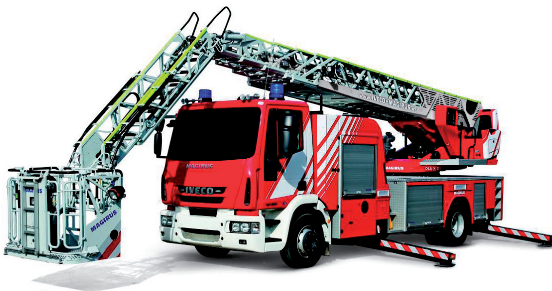
Ryc. 3. Drabina Iveco Magirus SD31 typ M32 L-AS na podwoziu IVECO MAGIRUS Euro Cargo 160 E 30 4x2, fot. Iveco Magirus.