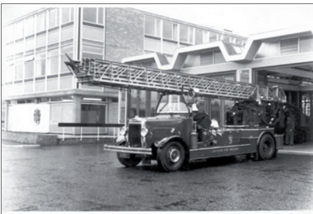
Ryc. 1. Drabina Metz z 1937 roku o wysokości 100 ft (30,5 m) [1].

Pierwsze drabiny powstały w drugiej połowie XIX w., czyli w okresie wielkiego rozwoju gospodarczego. Duży postęp naukowy, powstanie i rozwój fabryk, przyczyniły się do potrzeby budowania wielopiętrowych domów mieszkalnych dla robotników ściągających ze wsi do miast. Pierwsze drabiny to proste drewniane konstrukcje (jednomodułowe), zamontowane na wózku z pojedynczą osią. Do akcji ciągnięte były przez strażaków. Ze względu na materiał konstrukcyjny i słabe parametry, nie czyniły pracy strażaka łatwiejszą i bezpieczniejszą, choć były wielkim krokiem naprzód w rozwoju techniki ochrony-przeciwpożarowej. Postęp gospodarczy, o którym wspomnieliśmy, przyczynił się do szybkiego rozwoju konstrukcji drabin. Kolejne generacje to urządzenia montowane na podwoziach dwuosiowych, ciągniętych przez konie. Pozwoliło to na skrócenie czasu dotarcia do akcji, ale wciąż nie rozwiązywało problemów z parametrami wysokościowymi i palnością materiału z jakiego wykonana była drabina. Dopiero pierwsza połowa XX wieku była prawdziwym przełomem w rozwoju konstrukcji drabin. Nowo powstałe urządzenia, montowane na podwoziach samojezdnych, wyposażano w silnik – najpierw parowy, później – diesla, a drewno wyparte zostało przez metal, który jest materiałem cięższym, ale zdecydowanie bardziej wytrzymałym. Drabiny jednomodułowe zostały wyparte drabinami wielomodułowymi. Rozpoczęła się nowa era drabin.