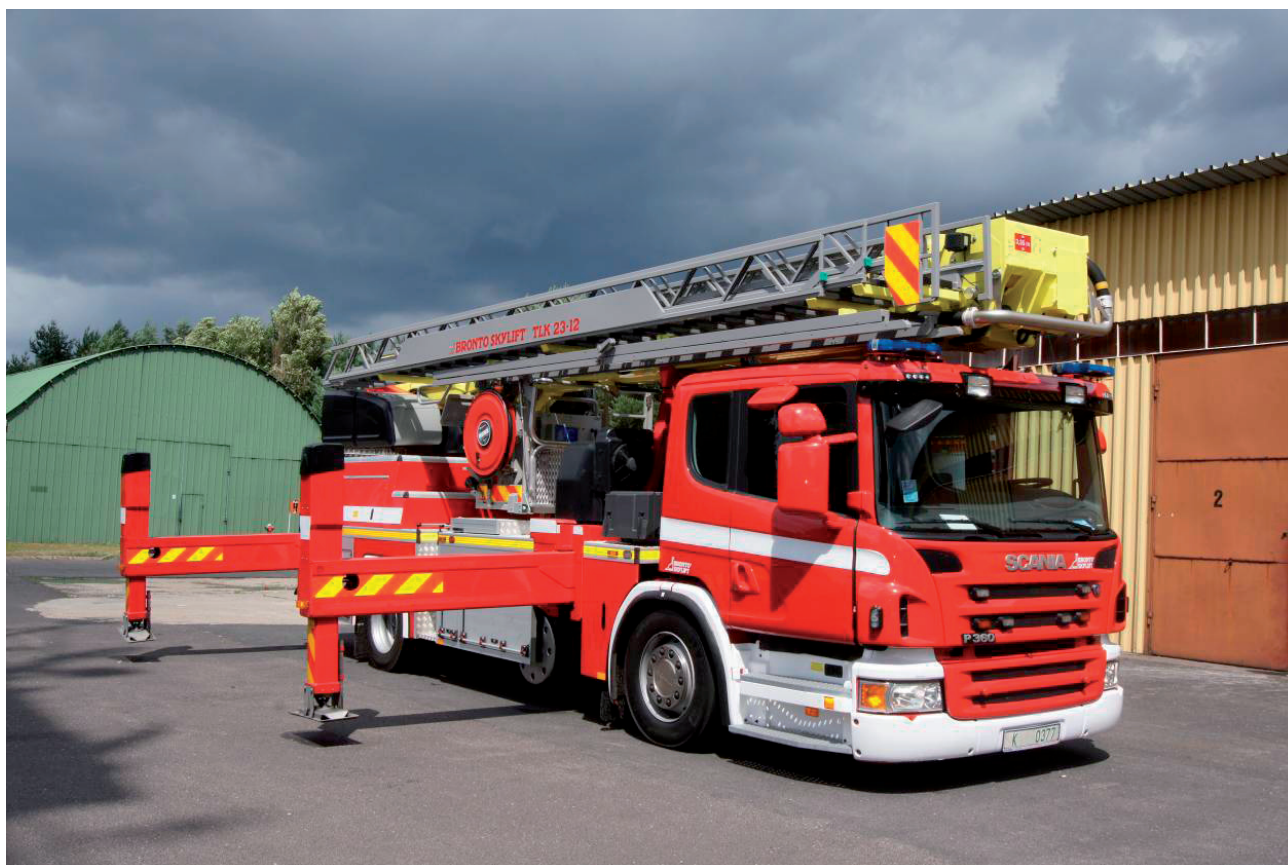
Ryc. 6. Podnośnik hydrauliczny SHD30 typ F32TLK na podwoziu Scania P360 (4x2) w czasie badań w CNBOP-PIB 2011 r., fot. Dariusz Czerwienko CNBOP-PIB.