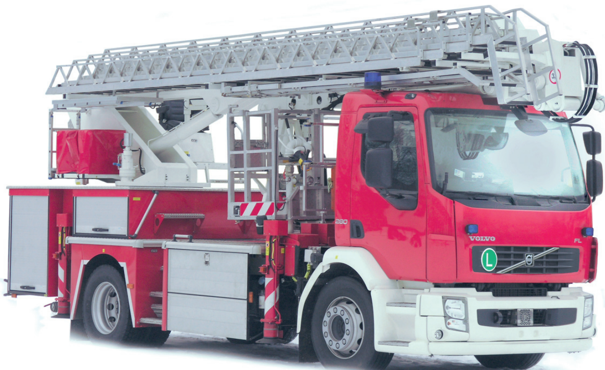
Ryc. 7. Podnośnik hydrauliczny SHD31 typ PMT-32D na podwoziu Volvo FL 4XR3 (4x2), fot. BUMAR-KOSZALIN.