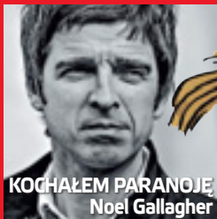
KOCHAŁEM PARANOJĘ Noel Gallagher