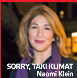
SORRY, TAKI KLIMAT Naomi Klein