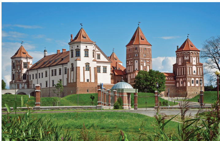
IL. 2. Zamek w Mirze, Białoruś