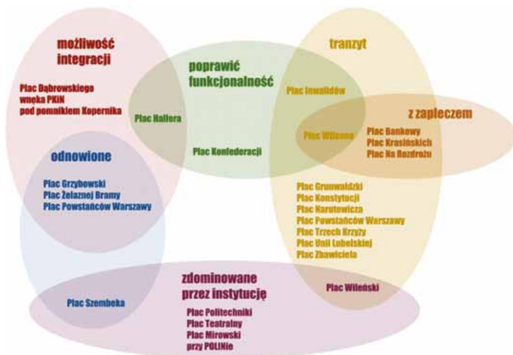
Ryc. 31. Autorski podział placów, pierwszy etap wyboru pól badawczych (opracowanie własne: Agata Ponichtera)