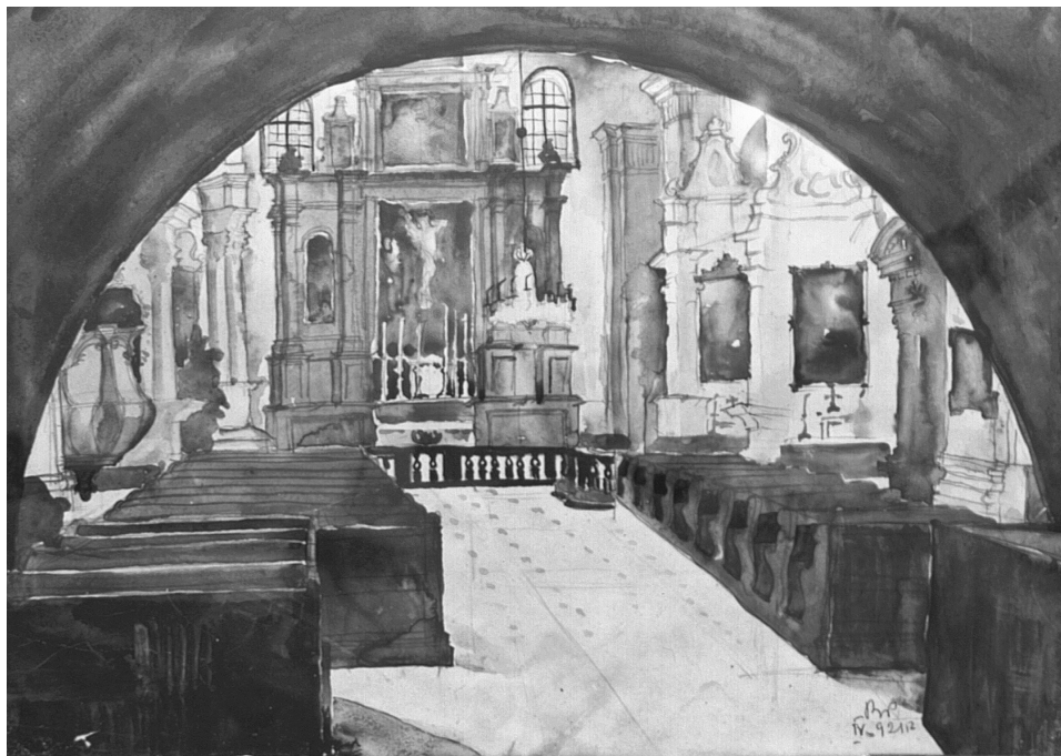
1. Akwarela Pniewskiego, 1921, własność prywatna

W zakresie kształcenia zawodowego pierwsze miejsce przypada zwłaszcza promotorowi Czesławowi Przybylskiemu, wykształconemu w paryskiej École des Beaux Arts, Politechnice w Karlsruhe i w Wiedniu oraz Tadeuszowi Tołwińskiemu, absolwentowi Politechniki w Karlsruhe. U każdego Pniewski rozwijał inny zakres umiejętności. U Przybylskiego ćwiczył się w umiejętności klarownego przestrzennie i funkcjonalnie rozwinięcia monumentalnej kompozycji architektonicznej. W dyplomowym projekcie giełdy (il. 2) o rozbudowanym programie funkcjonalnym (liczne pomieszczenia pomocnicze w skrzydłach bocznych) i zróżnicowaniu przestrzennym wzbogacił