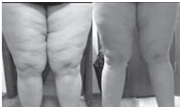
Powyższe zdjęcia przedstawiają cellulit typu Gumiś przed i po terapii.

Podsumowując, praca z tym rodzajem cellulitu polega na odblokowaniu napiętej powięzi, co umożliwia dotarcie do tkanki mięśniowej, dzięki czemu organizm może działać skuteczniej, a ty możesz pracować nad swoją tężyzną fizyczną – może po raz pierwszy w życiu.