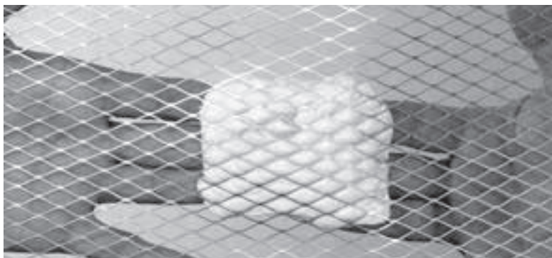
To zdjęcie przedstawia powięź, która wywołuje cellulit pod postacią Ran Gradowych. To pianka wciskana w siatkę.

Najprostszym sposobem na wizualizowanie sobie tego rodzaju powięzi jest metafora „skórki” w parówce czy kielbasce. (Wybacz mi, jeśli nie jesz mięsa, ale jej walory estetyczne naprawdę mają tu sens). Przy robieniu kielbasy wpycha się zmielone mięso do odpowiedniej formy. Kształt kielbasy nie zależy od ilości tłuszczu w mięsie. Jej wygląd jest zdeterminowany przez rozmiar i wygląd jej otoczki! Jeśli ta ma w sobie rowki jak piłka golfowa, to ostatecznie kielbaska będzie miała bruzdy dokładnie jak piłka. Gdy otoczka będzie wyglądała jak Myszka Mickey®, cała kielbasa będzie wyglądała tak samo. Teraz wyobraź sobie, że nasza błonka jest jak kabaretki. Jakiego możemy spodziewać się wyglądu tego produktu masarskiego? Ależ tak! Mięso będzie wysuwać się przez drobne otwory i wytworzy grudki, wgniecenia i wybrzuszenia. Brzmi znajomo... może przypomina to jakieś znajome nogi? Gdy powięzi są pozbawione wigoru, obecne są zaburzenia, zaciśnięcia, naciągnięcia i wybrzuszenia tkanki tłuszczowej wyciskającej się przez luki, tak jak to wygląda w przypadku mielonego mięsa w kabaretkach. (Wegetarianie mogą pomyśleć o wielkiej piance przyciskanej do siatki ogrodzeniowej!).