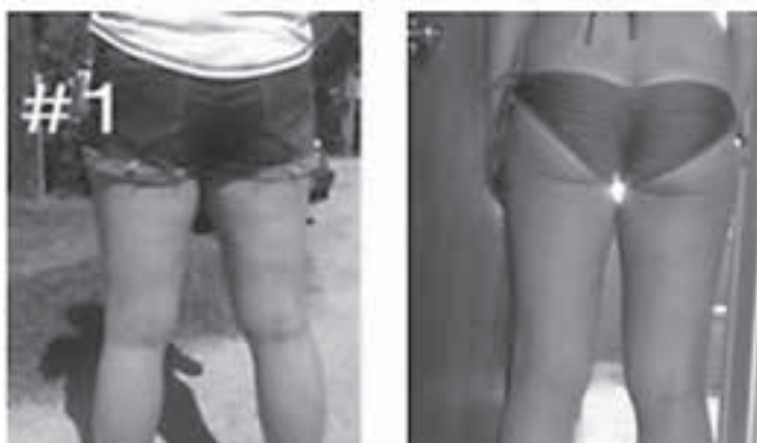
Zdjęcia przedstawiające etapy przed i po kuracji cellulitu BeyondBound™. Mimo że nie tak widowiskowy, ten rodzaj jest najbardziej dotkliwy dla organizmu.

to może trochę dłużej, bo O.Z.Z. znajdują się we wszystkich warstwach powięzi. W tym stanie wspinasz się po drabinie typów Dziwaczenia Powięzi i prezentujesz spory repertuar objawów związanych ze stanem tej tkanki. Przy BeyondBound™ powięź jest tak napięta, że nie możesz nawet uszczypnąć czy pociągnąć za swoją skórę, bo pod nią znajdują się twarde i złączone kawałki tkanki powięziowej. Osoba, u której ten stan opisuje całą strukturę ciała, przez większość czasu nie ma energii i ma problemy z krążeniem. Ciężko wtedy jakkolwiek ćwiczyć, często pojawiają się również skurcze nóg, wraz z chmurą innych problemów zdrowotnych napędzanych brakiem zdrowia tkanki powięzi. Jest jednak nadzieja, to wszystko można cofnąć!