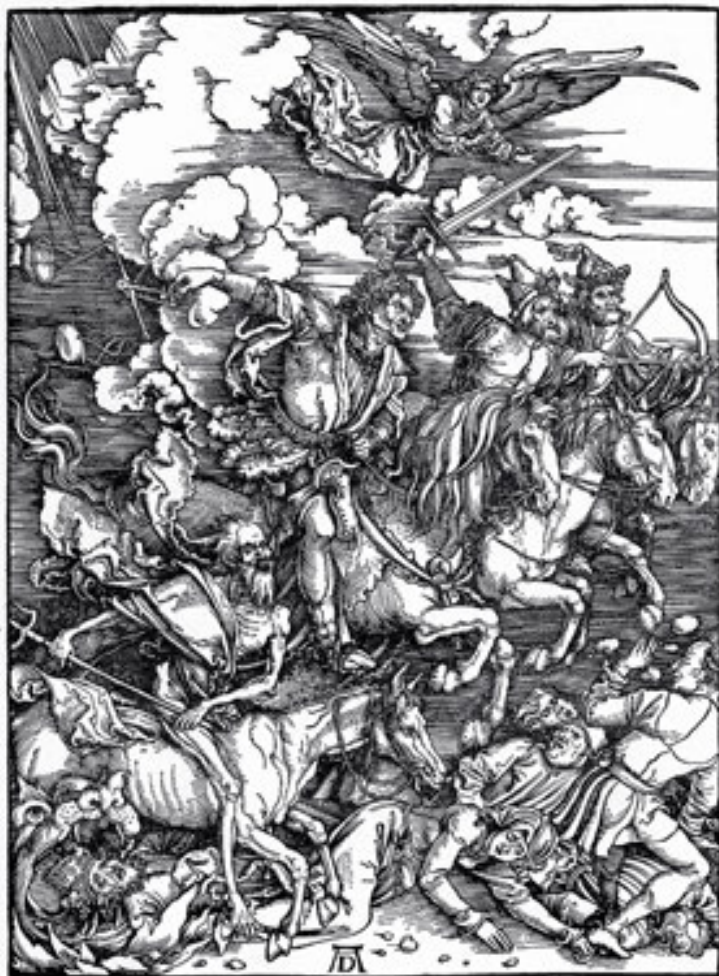
„Jeźdźcy Apokalipsy”, Albrecht Dürer, 1497–98 r.

Adwent – (łac. adventus – przybycie). Okres czterech niedziel radosnego przygotowania do uroczystości Bożego Narodzenia, początek roku liturgicznego. Jako adwent rozumiemy również paruzję, czyli powtórne przyjście Chrystusa. W obecnej formie wprowadzony przez papieża Grzegorza Wielkiego.