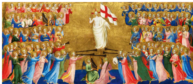
„Chrystus uwieleniony w niebie”, Fra Angelico (Jan z Fiesole), ok. 1423 r.