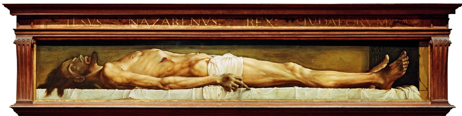
„Chrystus w grobie”, Hans Holbein młodszy, 1521–22 r. We wszystkich tradycjach chrześcijańskich wydarzenia męki, śmierci i zmartwychwstania Jezusa stanowią istotę wiary.