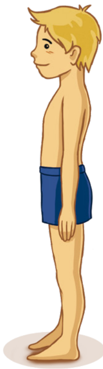
DZIECKO W WIEKU SZKOLNYM