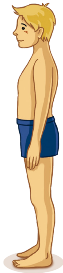
DZIECKO W OKRESIE DORASTANIA