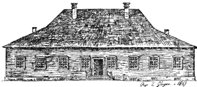
Ryc. 2 Dwór z wieku XVII w Kowalewsczyźnie na Podlasiu tykocińskim. (Z Budownictwa drzewnego Z. Glogera).

pod naporem prądów obcych, zalewających kraj nasz, następuje przełom w naszym budownictwie wiejskim i zupełne zerwanie z tradycją. Do tak zgubnego dla naszej rodzimej kultury przewrotu przyczynili się niestety w wysokim stopniu nasi młodzi inżyniero-