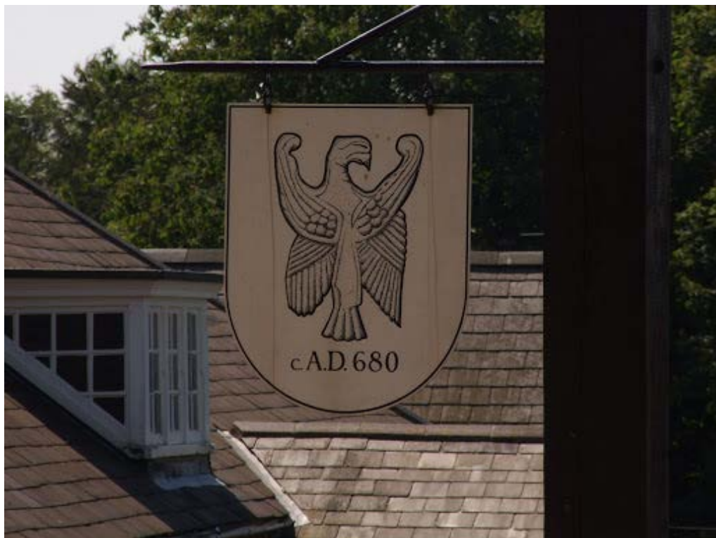
Fot. 1 Saxoński herb z VII wieku.

W ramach królestwa Mercii działał system administracyjny polegający na tworzeniu dystryktów zwanych “stoke”, które były podzielone na mniejsze działki, podległe królowi. Mieszkańcy mogli je dzierżawić w zamian za odpracowywanie lub płacenie danin na rzecz króla. Poszczególne “stoke” tworzyły większe posiadłości,