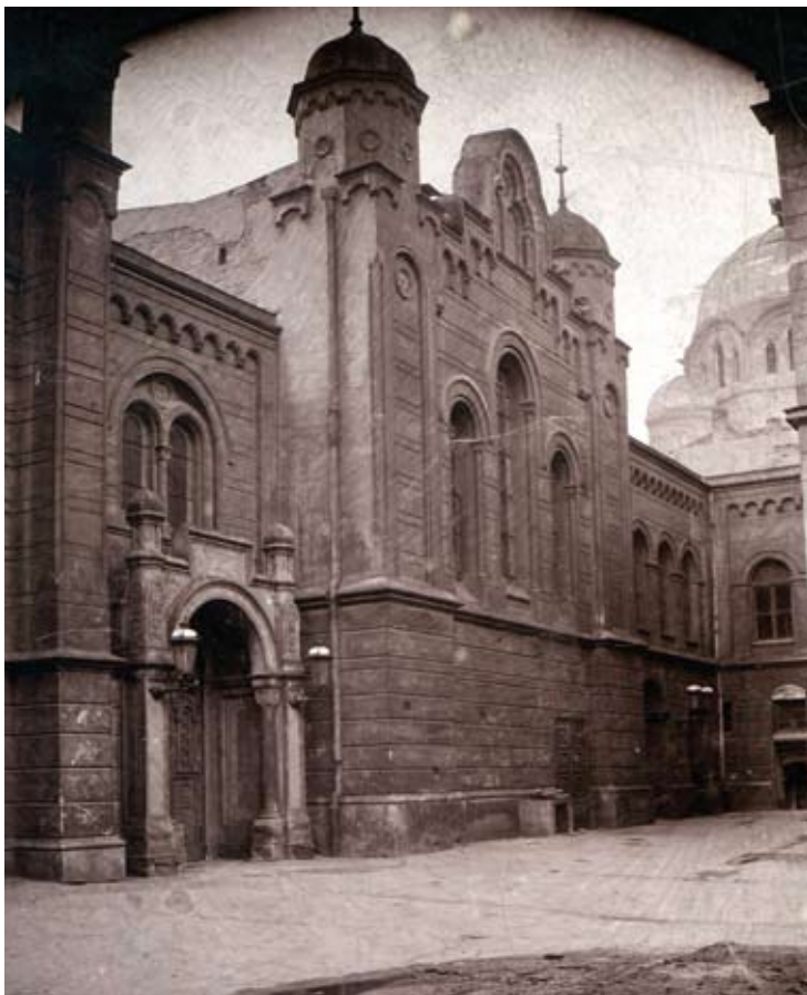
Fasada Nowej Synagogi (Neue Betschule) przy ul. Żydowskiej, fot. z początku XX w. S. Jaffé. Ze zb. BU.