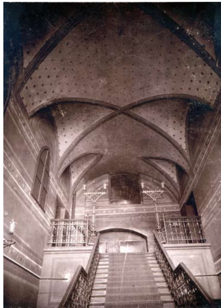
Wnętrze Nowej Synagogi (Neue Betschule) przy ul. Żydowskiej, fot. z początku XX w. S. Jaffé. Ze zb. BU.

jedna sala z ostrołukowymi oknami w górnej części ścian północnej i południowej. Pomędzy 1550 i 1564 rokiem do tejże sali dobudowano przedsionek, który mógł być wykorzystywany jako miejsce obrad sądu lub zebrań starszyny kahału. Rozwiązania architektoniczne poznańskiej synagogi zostały powielone w Gnieźnie, gdzie w latach 80. XVI wieku zbudowano świątynię dla tamtejszej gminy.