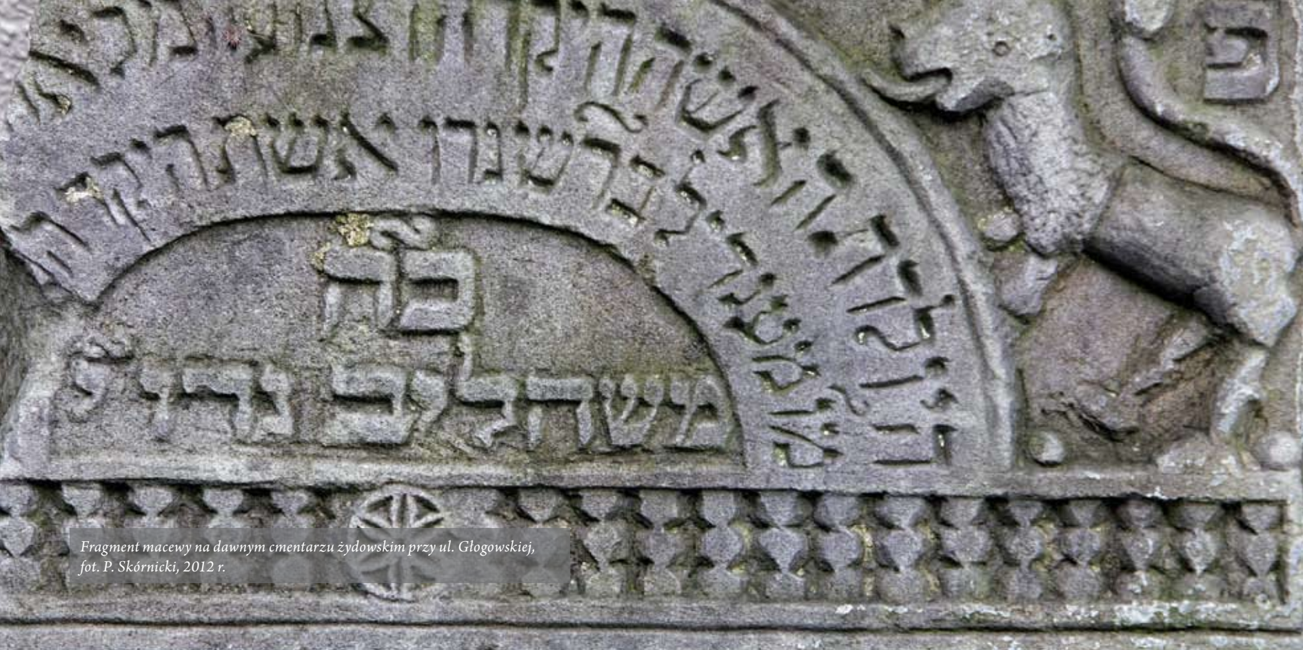
Fragment macewy na dawnym cmentarzu żydowskim przy ul. Głogowskiej, fot. P. Skórnicki, 2012 r.