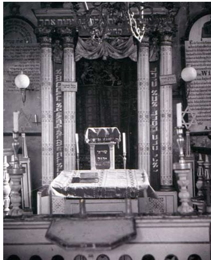
Aron ha-kodesz Synagogi Nehemiasza (Nehemias Betschule) przy ul. Żydowskiej, fot. z początku XX w. S. Jaffé. Ze zb. BU.

Na przełomie XVI i XVII wieku, prawdopodobnie po pożarze dzielnicy żydowskiej w czerwcu 1590 roku, zbudowano tzw. Nową Synagogę przylegającą do północnej ściany wcześniejszej świątyni. 16 marca 1717 roku w bóżnicy wybuchł pożar, na szczęście w porę ugaszony, choć ogień strawił wiele ksiąg i dokumentów. Bóżnica posiadała jedną, prostokątną salę modlitewną, większą i szerszą od tej, która znajdowała się w tzw. Starej Synagodze, oraz galerię dla kobiet. W 1803 roku wraz ze Starą Synagogą padła ofiarą szalejącego w Poznaniu pożaru. Obie świątynie zostały